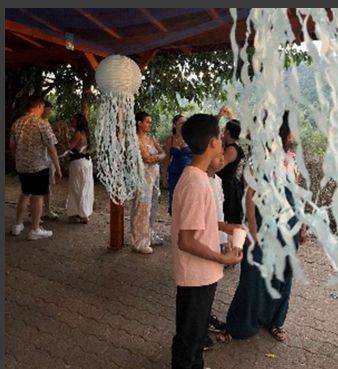
Soirée de la MDL 24 juin